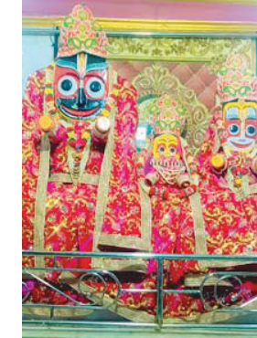
नगर संवाददाता ■ ग्वालियर

शहर से 20 किलोमीटर दूर ग्राम कुलैथ में पुरी की तर्ज पर भगवान जगन्नाथ 9 जुलाई गुरुवार को एकांतवास में चले जाएंगे और 15 जुलाई को भक्तों को दर्शन देंगे। इस दौरान सामान्य श्रद्धालुओं के लिए भगवान के पट बंद रहेंगे