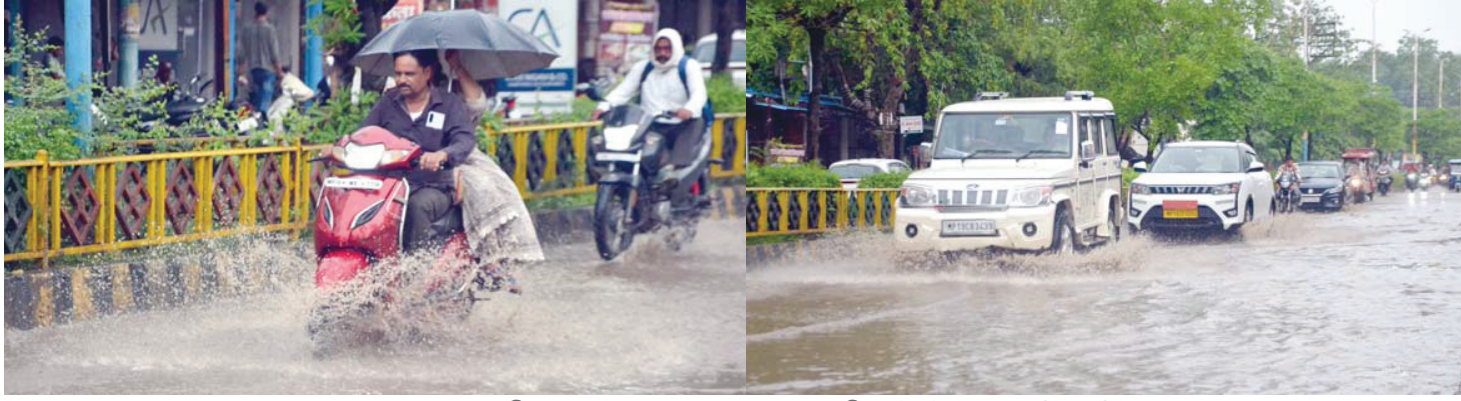
[ मौसम ] जिले में अब तक 187.7 मिलीमीटर वर्षा दर्ज