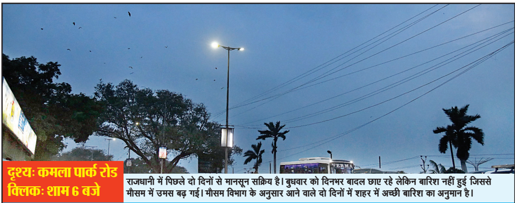
दृश्य: कमला पार्क रोड विलक: शाम 6 बजे

राजधानी में पिछले दो दिनों से मानसून सक्रिय है। बुधवार को दिनभर बादल छाए रहे लेकिन बारिश नहीं हुई जिससे मौसम में उमस बढ़ गई। मौसम विभाग के अनुसार आने वाले दो दिनों में राहर में अच्छी बारिश का अनुमान है।