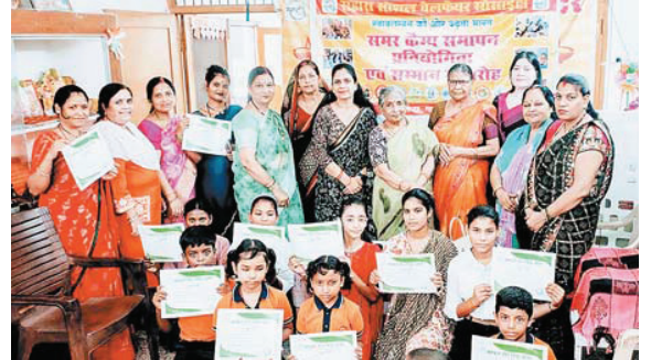
ग्वालियर (नगर संवाददाता)