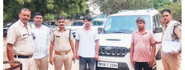
ग्वालियर (नगर संवाददाता)

गोला का मंदिर थाना क्षेत्र में तेजी व लापरवाही से स्काॅर्पियो चलाकर बछिया को कुचलकर भागे आरोपी चालक को पुलिस ने गिरफ्तार कर लिया है। पकड़े गए चालक से पुलिस ने घटना के बारे में पूछताछ की। पंचशील नगर में 1 जुलाई को स्काॅर्पियो चालक ने सड़क किनारे बैठी बछिया को कुचल दिया था। गाड़ी की चपेट में आकर बछिया ने तड़प तड़पकर दम तोड़ दिया था। उक्त घटना के बाद से ही पुलिस