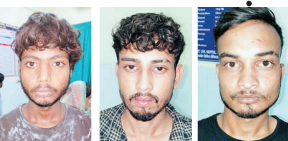
ग्वालियर (नगर संवाददाता)