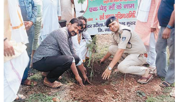
ग्वालियर (नगर संवाददाता)

मप्र जन अभियान परिषद के स्थापना दिवस के अवसर पर 4 से 12 जुलाई तक एक पेड़ मां के नाम लगाकर स्वीच्छक पर्व के रूप में मनाने का संकल्प नवांकुर संस्था सर्वे भवन्तु सुखिनः समिति ने लिया है। इसी क्रम में 4 जुलाई को उटीला सेक्टर के ग्राम पंचायत बस्ती के