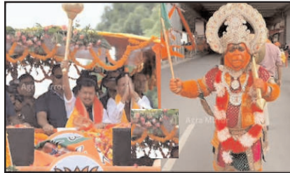
हनुमान हिंदुओं के लिए सबसे पूजनीय देवता