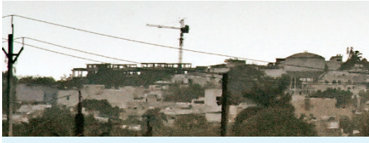
भोपाल (नगर संवाददाता)

राजधानी में रविवार को सुबह से शाम तक बादल छाए रहे। शाम 5 बजे के बाद मौसम में बदलाव हो गया है और गरज-चमक के साथ बारिश शुरू हो गई। रुक-रुककर रात तक बारिश होती रही। इस दौरान शहर का अधिकतम पारा 30.8 डिग्री और न्यूनतम तापमान 25.4 डिग्री दर्ज हुआ। मौसम केंद्र के पूर्वानुमान के मुताबिक राजधानी में सोमवार को भी गरज-चमक की स्थिति बनी रहेगी। इस दौरान बारिश के भी आसार