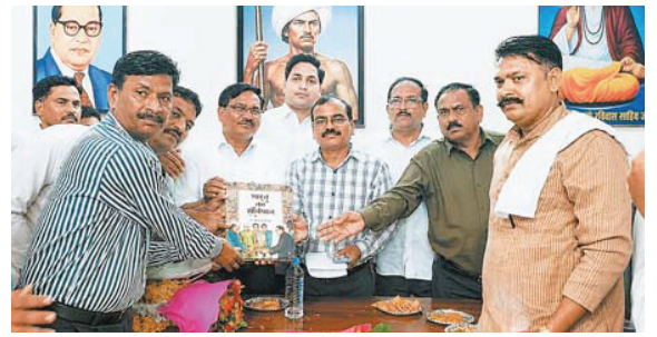
ग्वालियर (नगर संवाददाता)

जन तक पहुंचाना होगा। उन्होंने कहा कि समाज की प्रगति के लिए आर्थिक वर्ग की महिलाओं को माता सावित्रीबाई फुले के विचारों से शिक्षित करना आवश्यक है। उन्होंने समाज को कमजोर करने वाली प्रवृत्तियों के खिलाफ संगठित होकर संवैधानिक और लोकतांत्रिक तरीके से कार्य करने का आह्वान किया। उन्होंने संविधान की मूल भावना, सामाजिक न्याय, समानता, बंधुत्व और संवैधानिक अधिकारों की रक्षा पर जोर देते हुए महिलाओं, युवाओं और वंचित वर्ग की भागीदारी बढ़ाने की बात कही। बैठक के अंत में सभी पदाधिकारियों ने संविधान की मर्यादा, सामाजिक न्याय और राष्ट्र निर्माण के लिए समर्पित भाव से कार्य करने का सामूहिक संकल्प बिरसा मुंडा के विचारों को जन-