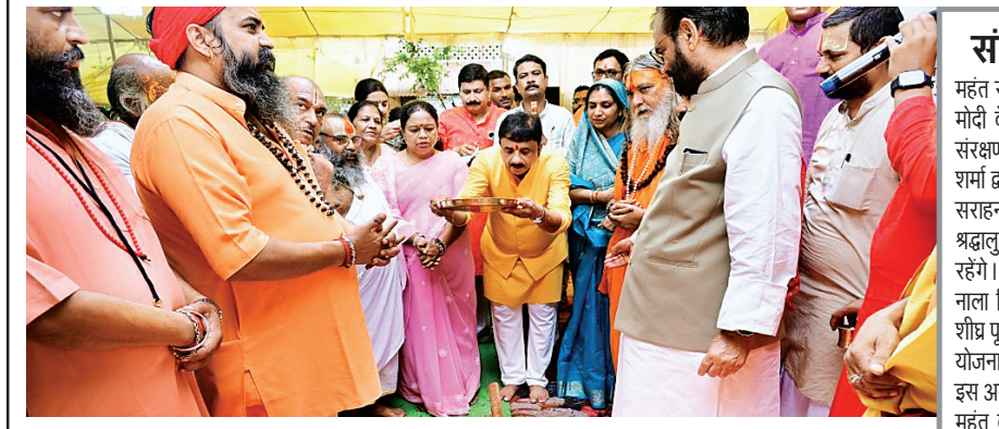
भोपाल (नगर संवाददाता)