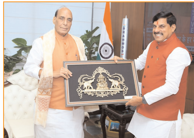
मुख्यमंत्री डॉ. मोहन यादव ने नई दिल्ली में केंद्रीय रक्षा मंत्री श्री राजनाथ सिंह से उनके कार्यालय में शिष्टाचार भेंट की।

भोपाल। मुख्यमंत्री डॉ. मोहन यादव के नेतृत्व में प्रदेश में तकनीकी विकास के लिये निरंतर कार्य किये जा रहे हैं। विज्ञान एवं प्रौद्योगिकी विभाग द्वारा 13 जुलाई 2026 को भोपाल में एमपी टेक ग्रोथ कॉन्वलेव 3.0 - जीसीसी, डेटा सेंटर एवं सेमी कंडक्टर एडिशन का आयोजन किया जा रहा है। इसका उद्देश्य उच्च-विकास वाले प्रौद्योगिकी क्षेत्रों में निवेश को गति देना और ग्लोबल कैपेबिलिटी सेंटर (जीसीसी), डेटा सेंटर एवं सेमी कंडक्टर क्षेत्र में प्रदेश को देश के प्रमुख निवेश गंतव्यों में स्थापित करना है। कार्यक्रम में मुख्यमंत्री डॉ. यादव राज्य सरकार के प्रौद्योगिकी आधारित औद्योगिक विकास के विजन को साझा करेंगे और उद्योग जगत के प्रतिनिधियों के साथ संवाद कर निवेश, परियोजनाओं के क्रियान्वयन एवं भावी सहयोग की संभावनाओं पर चर्चा करेंगे। एमपी टेक ग्रोथ संबंधी पहली 2 कॉन्वलेव ने प्रदेश में प्रौद्योगिकी निवेश को नई गति प्रदान की है। कॉन्वलेव 1.0 में 20 हजार करोड़ रुपये से अधिक के निवेश प्रस्ताव प्राप्त हुए, जिनसे लगभग 75 हजार रोजगार के अवसर सृजित हुए। कॉन्वलेव 2.0 में 12 हजार करोड़ रुपये से अधिक के निवेश प्राप्त हुए, जिनसे लगभग 48 हजार रोजगार के अवसर सृजित हुए।