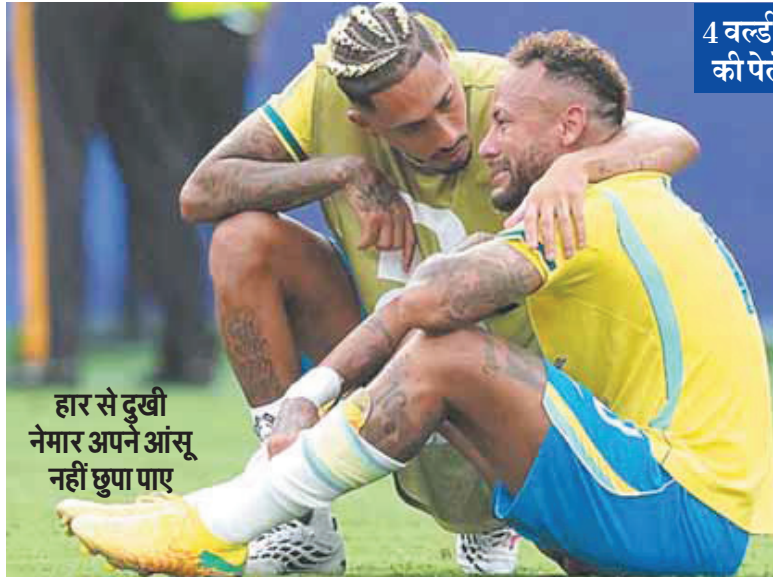
हार से दुखी नेमार अपने आंसू नहीं छुपा पाए

5 बार का चैंपियन ब्राजील फुटबॉल वर्ल्ड कप से बाहर हो गया है। नॉर्वे ने सोमवार को प्री क्वार्टर फाइनल में ब्राजील को 2-1 से हराया। नॉर्वे पहली बार क्वार्टर फाइनल में पहुंचा है। अब उसका मुकाबला इंग्लैंड से होगा। इंग्लिश टीम ने प्री क्वार्टर फाइनल में मेजबान मैक्सिको को 3-2 से हराया। ब्राजील के स्टाफ फुटबॉल नेमार ने इस हार के बाद संन्यास ले लिया है। उन्होंने अमेरिकी के न्यू जर्सी स्टेडियम में खेले गए इस मुकामबले में ब्राजील की ओर से एकमात्र गोल किया। नॉर्वे की ओर से एरलिंग हॉलैंड ने दोनों गोल दागे। 34 साल नेमार ने कहा, 'मैंने पूरी कोशिश की। मेरा सफर यहीं से शुरू हुआ था और अब यहीं खत्म हो गया। ब्राजील के लिए मेरा अहसास अब समाप्त हो चुका है।' उन्होंने 2010 में इसी मैदान (तत्कालीन मेटलाइफ स्टेडियम) पर अमेरिका के खिलाफ ब्राजील के लिए डेब्यू किया था।